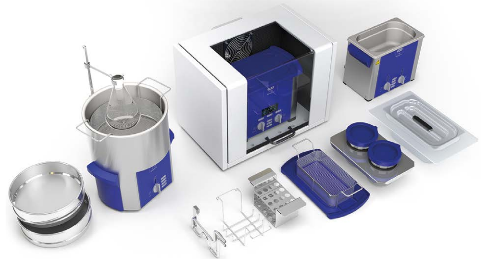
Elmasonic S und Elmasonic P mit Zubehör

Bei Fragen oder im Garantiefall wenden Sie sich an unseren Technical Support unter: support@elma-ultrasonic.com oder +49 7731 882-280