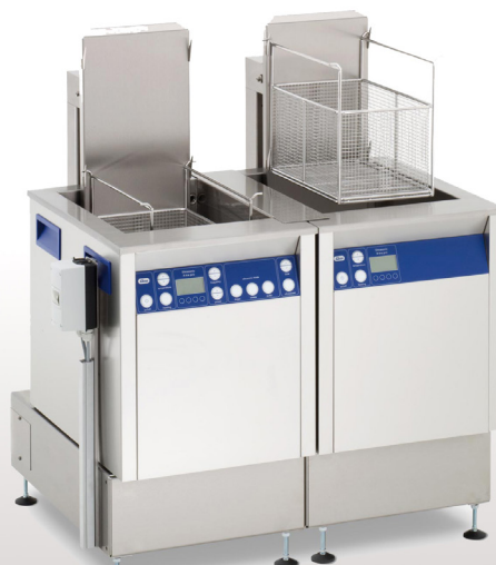
Illustration Elmasonic X-tra Line 550 Flex 2

Ligne de nettoyage modulaire se composant d'un appareil de nettoyage aux ultrasons et d'une cuve de rinçage, disponible en 5 tailles différentes (300, 550, 800, 1200 et 1600). Les appareils sont réalisés en 2 versions multifréquence : 25/45 kHz (MF2) ou 37/130 kHz (MF3). Cuve de rinçage version (S): avec chauffage (H) ou sans chauffage. Le dispositif d'oscillation du panier favorise l'efficacité du nettoyage et du rinçage, il permet aussi l'égouttage du panier (EKO). D'autre part, la ligne modulaire permet de raccorder un sécheur à air chaud (WLT), disponible dans la taille correspondante à l'appareil utilisé. Un support est compris dans les fournitures.