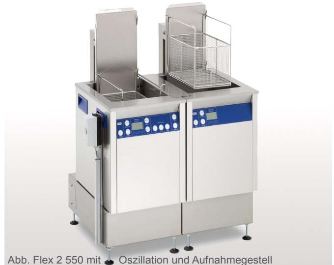
Abb. Flex 2 550 mit Oszillation und Aufnahmegestell

Modulare Reinigungslinie bestehend aus Ultraschall-Reinigungsgerät und Spülwanne, erhältlich in 5 Gerätegrößen (300, 550, 800, 1200 und 1600). Ausführungsvarianten Ultraschall-Reinigungsgerät: Multifrequenz 25/45 kHz (MF2) oder 37/130 kHz (MF3). Ausführungsvarianten Spülwanne (S): mit Heizung (H) oder ohne Heizung. Die Oszillationsvorrichtung für den Reinigungskorb unterstützt die Reinigungs- und Spülwirkung und bietet eine Abtropfposition für den Edelstahlkorb (EKO). Des Weiteren ist ein Warmlufttrockner (WLT) in der jeweiligen Gerätegröße erhältlich. Im Lieferumfang ist ein Aufnahmegestell enthalten.