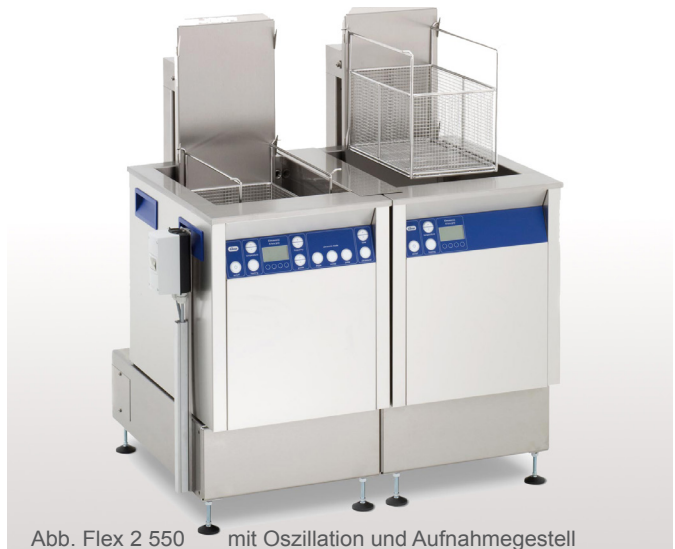
Abb. Flex 2 550 mit Oszillation und Aufnahmegestell

Modulare Reinigungslinie bestehend aus Ultraschall-Reinigungsgerät und Spülwanne, erhältlich in 5 Gerätegrößen (300, 550, 800, 1200 und 1600). Ausführungsvarianten Ultraschall-Reinigungsgerät: Multifrequenz 25/45 kHz (MF2) oder 37/130 kHz (MF3). Ausführungsvarianten Spülwanne (S): mit Heizung (H) oder ohne Heizung. Die Oszillationsvorrichtung für den Reinigungskorb unterstützt die Reinigungs- und Spülwirkung und bietet eine Abtropfposition für den Edelstahlkorb (EKO). Des Weiteren ist ein Warmlufttrockner (WLT) in der jeweiligen Gerätegröße erhältlich. Im Lieferumfang ist ein Aufnahmegestell enthalten.