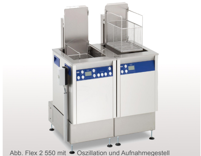
Abb. Flex 2 550 mit Oszillation und Aufnahmegestell

Modulare Reinigungslinie bestehend aus Ultraschall-Reinigungsgerät und Spülwanne, erhältlich in 5 Gerätegrößen (300, 550, 800, 1200 und 1600). Ausführungsvarianten Ultraschall-Reinigungsgerät: Multifrequenz 25/45 kHz (MF2) oder 37/130 kHz (MF3). Ausführungsvarianten Spülwanne (S): mit Heizung (H) oder ohne Heizung. Die Oszillationsvorrichtung für den Reinigungskorb unterstützt die Reinigungs- und Spülwirkung und bietet eine Abtropfposition für den Edelstahlkorb (EKO). Des Weiteren ist ein Warmlufttrockner (WLT) in der jeweiligen Gerätegröße erhältlich. Im Lieferumfang ist ein Aufnahmegestell enthalten.