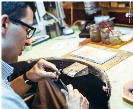
Nettoyage de bagues, de colliers, de boucles d'oreilles, etc.