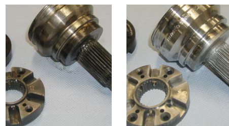
Élimination des oxydations et autres encrassements