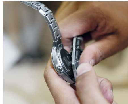
Nettoyage de pièces d'horlogerie comme les montres, les boîtiers, etc.

Les appareils à ultrasons Elmasonic xtra TT sont conçus pour l'application dans la production, les ateliers et le service. Les équipements comme la fonction Sweep durablement intégrée, la fonction Dynamic individuelle ou la température seuil réglable individuellement avec voyant d'avertissement à LED, facilitent le nettoyage des pièces au quotidien.