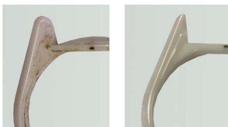
Élimination de pâtes de polissage