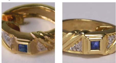
Élimination des impuretés