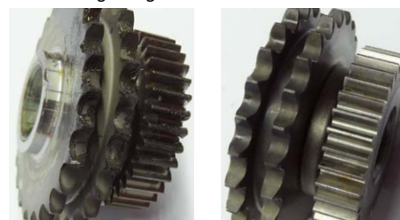
Nettoyage de graisse et de silicone