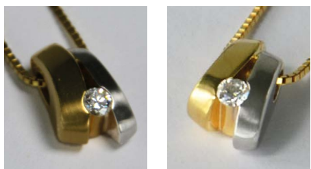
Élimination de pâtes de polissage