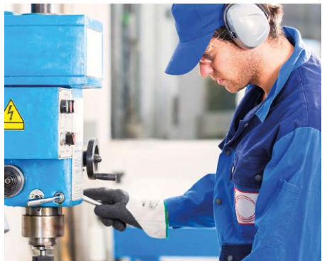
Nettoyage industriel de pièces par ex. des pièces de moteur, de filtres, etc.

Appareils de table robustes pour les applications à ultrasons à haut débit