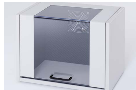
Boîtier de protection sonore