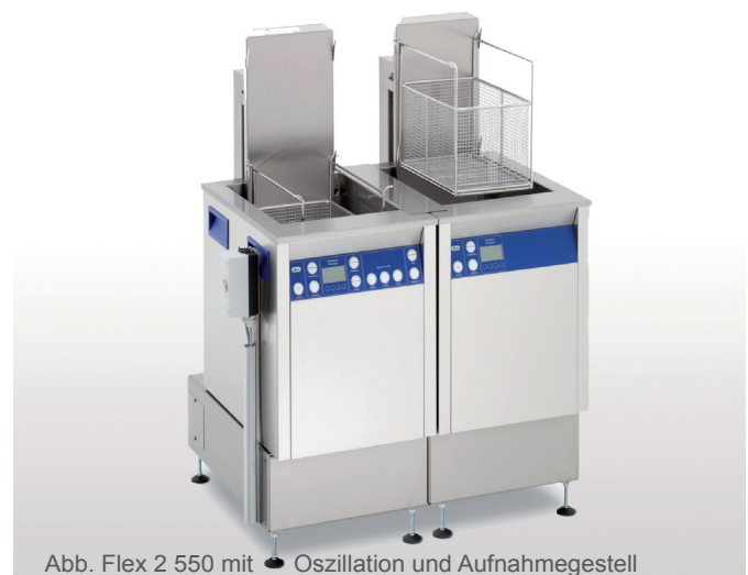
Abb. Flex 2 550 mit Oszillation und Aufnahmegestell

Modulare Reinigungslinie bestehend aus Ultraschall-Reinigungsgerät und Spülwanne, erhältlich in 5 Gerätegrößen (300, 550, 800, 1200 und 1600). Ausführungsvarianten Ultraschall-Reinigungsgerät: Multifrequenz 25/45 kHz (MF2) oder 35/130 kHz (MF3). Ausführungsvarianten Spülwanne (S): mit Heizung (H) oder ohne Heizung. Die Oszillationsvorrichtung für den Reinigungskorb unterstützt die Reinigungs- und Spülwirkung und bietet eine Abtropfposition für den Edelstahlkorb (EKO). Des Weiteren ist ein Warmlufttrockner (WLT) in der jeweiligen Gerätegröße erhältlich. Im Lieferumfang ist ein Aufnahmegestell enthalten.